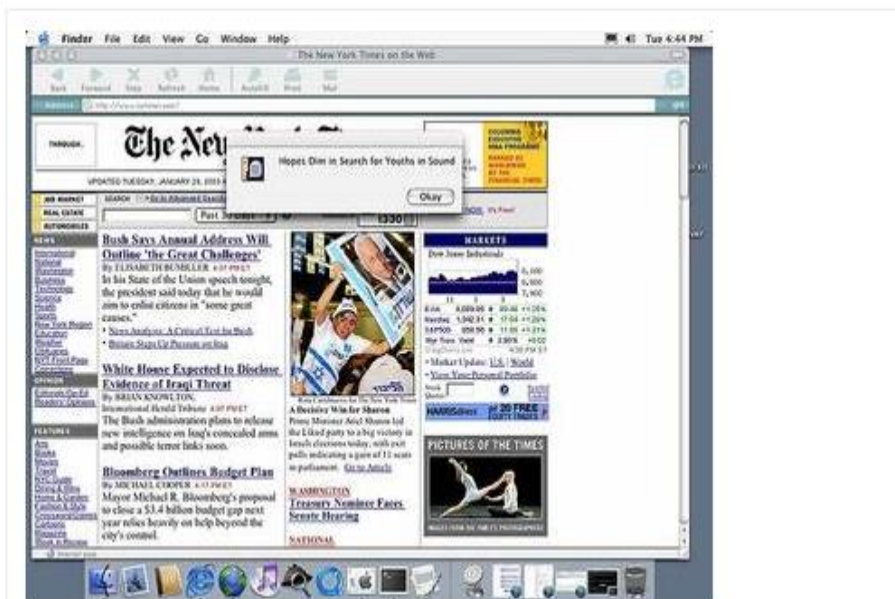
Ross, Rebecca (2000) The Okay News . [Art/Design Item]