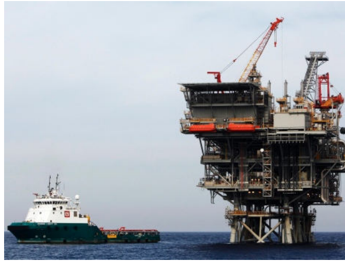
אסדת קידוח גז במאגר תמר

קניות באינטרנט נפתלי בנט יאיר לפיד רמי לוי פנסיה דמי ניהול ביטוח צרפת משכנתאות גולן טלקום מילון מונחים כלכליים בשוק ההון יצחק תשובה משפחת עופר נוחי דנקנר ריכוזיות